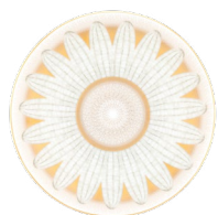
Aassiettes à pain Bread Plates Ref : 05918/P205