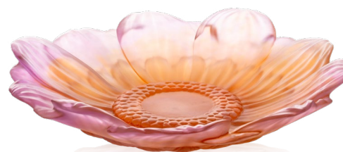
Fleur de présentation moyen modèle ambre rose Medium Amber-Pink Presentation Flower Ref : 05917