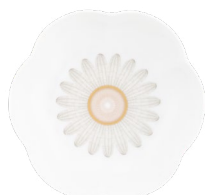
Coupes saveur fleur Floral Tasting Bowls Ref : 05918/P208