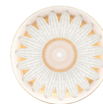
Assiette à dessert Dessert Plate Ref : 05918/P204