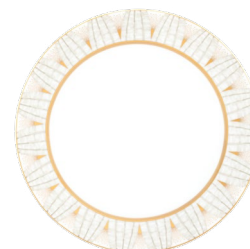
Assiette gastronomie Dinner Plate Ref : 05918/P202