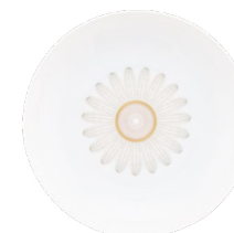
Assiettes creuse calotte Rimless Soup Plate Ref : 05918/P203