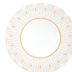
Assiette creuse à aile Rim Soup Plate Ref : 05918/P201