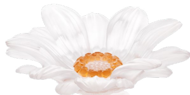
Fleur de présentation petit modèle blanche Small White Presentation Flower Ref : 05886-1