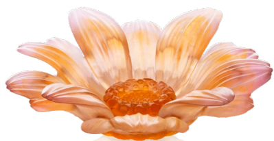
Fleur de présentation petit modèle ambre rose Small Amber-Pink Presentation Flower Ref : 05886