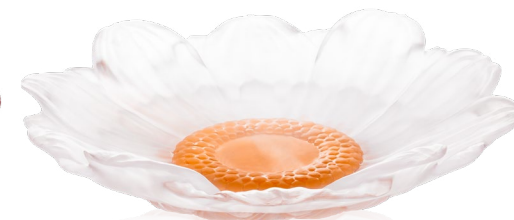
Fleur de présentation moyen modèle blanche Medium White Presentation Flower Ref : 05917-1